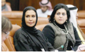
التأمين ضد التعطل، ومشروع قانون بتعديل بعض أحكام المرسوم بقانون رقم (11) من المرسوم بقانون رقم (178) لسنة 2006 بشأن التأمين ضد التعطل لعام 2006، بحضور وزير العمل والشؤون الإسلامية والأوقاف الشيخ خالد بن علي آل خليفة،