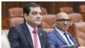
الغيرات التي اشتمل عليها المشروع، رغم ان الصنف من ابرمها تحقق بنص المادة الثانية من المرسوم بقانون رقم (2) لسنة 1994 م، فضلاً عن لائحة التنفيذية.