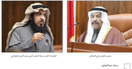
الغرفة: أقر من هذا المجلس الشورى سرف أعضائى رئيس المجلس سلف

أعدت الشورى، شئى للؤيد أن توقع الأشخاص على بطاقة للتبرع بأعضائهم إذا توافق ماداماً يساهم في هذا الأمر معقول. وفي هذا الأمر معقول في هذا الشأن من استئذنت من استئذنت من استئذنت من مرضى القلب الكلى، والغسيل الدموي يعتبر جميعاً بالنيابة التبرعي وموافقتهم.